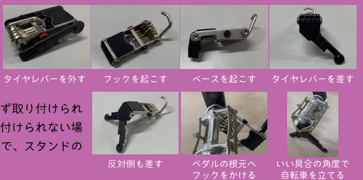
タイヤレバーを外す フックを起こす ベースを起こす タイヤレバーを差す