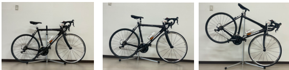
← 814mm～1,200mm → (700Cの自転車使用時)

持ち運びを前提とした軽量・コンパクトなアルミ製モデル。伸縮式支柱を採用し、自転車の対応サイズも広がりました。