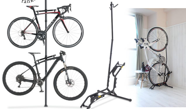
Bike Tower25D / DS-2200

屋内展示 / 収納として人気の製品がランクインです! 複数台用は「バイクタワー 25D」、1 台用は「DS-2200」です。所有している自転車の台数や住環境に応じてバイクタワーが選ばれているのかもしれませんが、1 台だけ所有されている方は、普段乗りの車体を置いておくために据え置きタイプの DS-2200 をえらんでいるのでしょうか? どんなふうに使われているのか、気になります・・・。