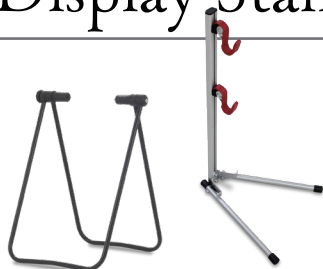
DS-30TA / DS-534-600L

1 台用のスタンドとしては、後輪挟み込み DS-30 シリーズから、DS-30TA がランクインしました。ハブ軸にレバーが無いスルーアクスル車専用のスタンドなので、これが一番に来たのは驚きです。続く DS-534-600L は、ほとんどの車体で使えて、ハブを挟み込むタイプでは対応できない車体でも掛けられるため、今では一番使い易いスタンドとなっています。